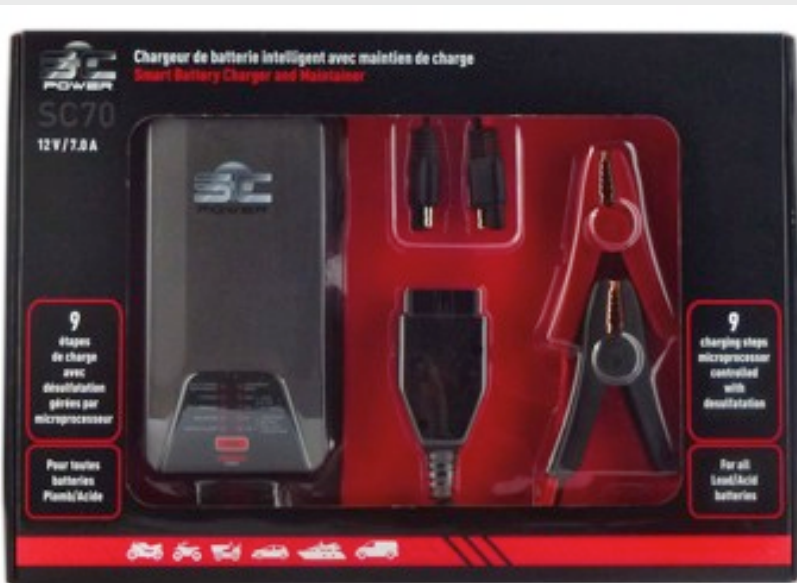
Packaging cartonné avec fenêtre haut de gamme