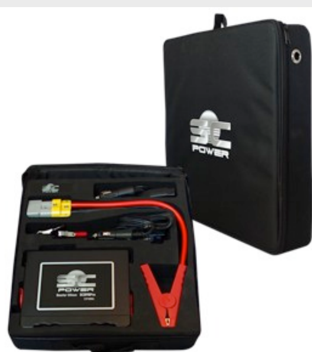
Housse haut de gamme thermoformée du Booster SCB90Pro, 1000A, 12V